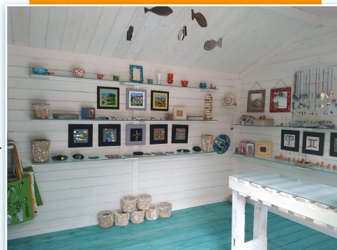
Foto dell'esterno e dell'interno del nuovo shop de Il Mosaico di Andreina.